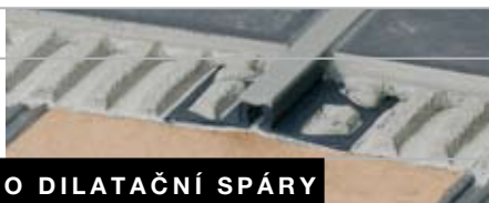
PROFIL PRO DILATAČNÍ SPÁRY